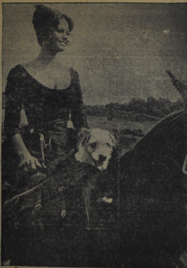
A foto registra um dos momentos gloriosos da vida artística da atriz Cláudia Cardinale. A atriz declarou à imprensa norte-americana, recentemente que deixará brevemente sua carreira.